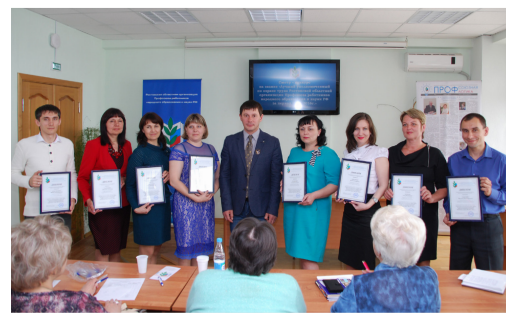
Областной смотр-конкурс на звание «Лучший уполномоченный по охране труда Профсоюза».