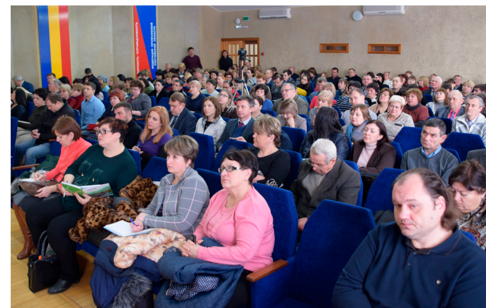
Семинар по повышению квалификации внештатных технических инспекторов труда и уполномоченных (доверенных) лиц по охране труда.

Считаю, что мероприятия, посвященные «Году охраны труда в Профсоюзе», 100-летней годовщине технической инспекции труда и Всемирного дня охраны труда 28 апреля послужат руководством к действию профсоюзных организаций и работодателей для принятия мер, направленных на охрану труда, укрепление здоровья и предупреждение профессиональных заболеваний работников образования.