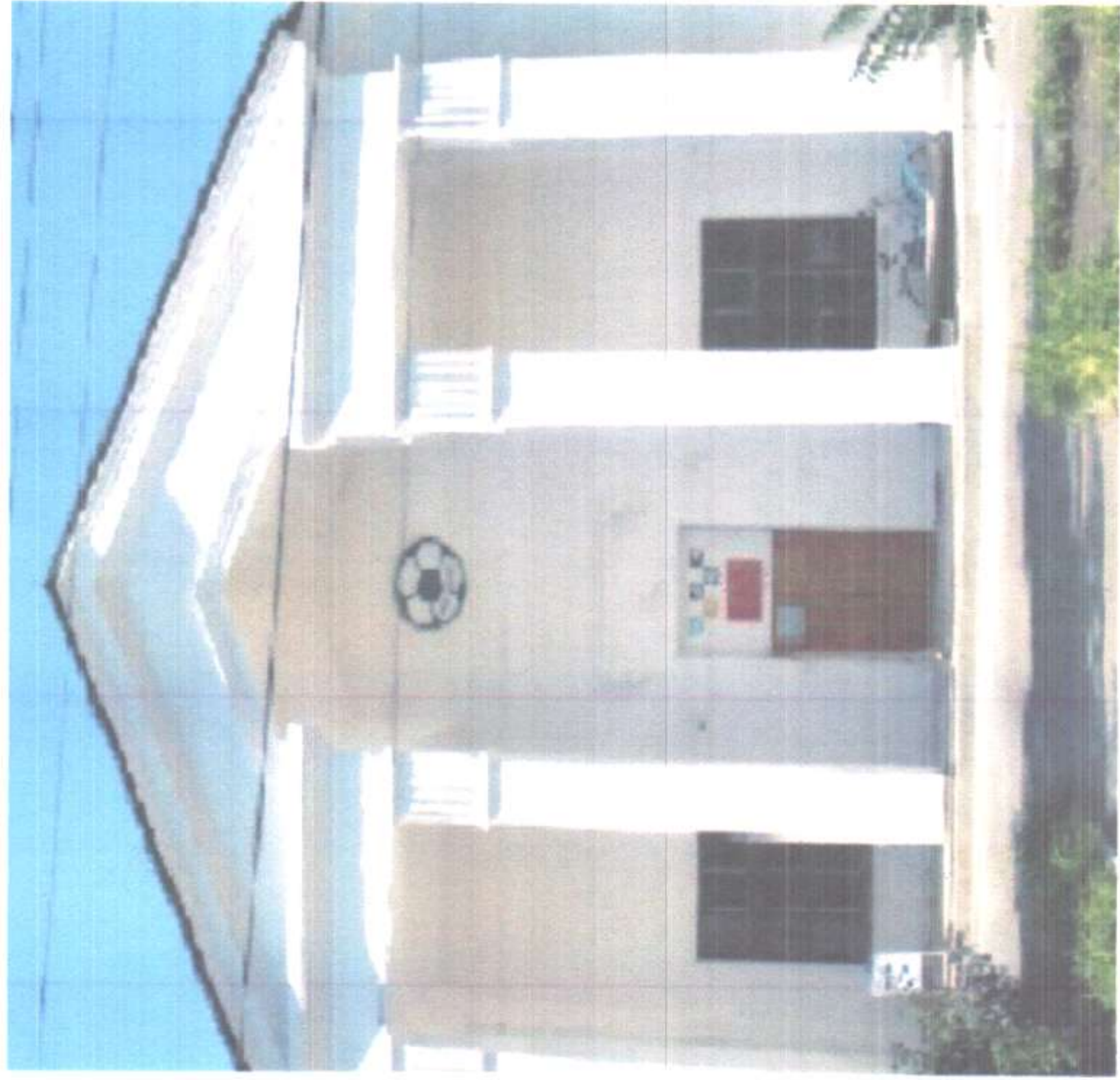
п.Тарасовский ул.Ленина 124