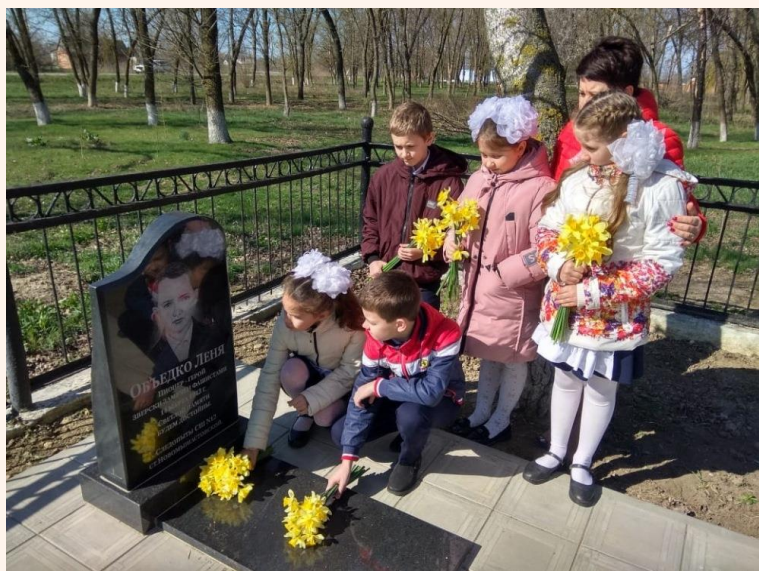
Ученики школы № 44 х. Семисводного у могилы Лёни Обьедко

7 мая 1982 года на могиле был установлен памятник. Средства на него собирали ученики школы № 44 х. Семисводного. 5 мая 2010 года останки Лёни Обьедко были перезахоронены в мемориале «Солдату-освободителю», рядом с братской могилой. В апреле 2019 года памятник был заменён на новый.