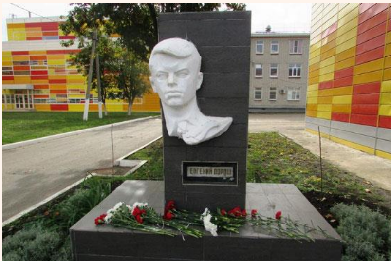
Бюст Жени Дороса

Школа № 66 г. Краснодара носит имя Жени Дороса. Во дворе школы установлен бюст юному патриоту, а в школьном музее оформлен уголок памяти пионера-героя. Известны воспоминания о Жене Доросе. Существует и песня об этом юном герое.