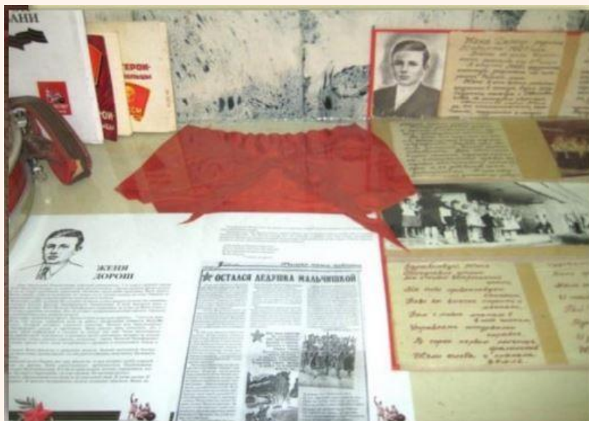
Уголок, посвященный Жене Дорошу, в музее школы № 66 г. Краснодара