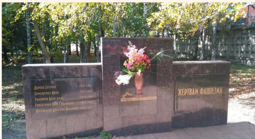
Братская могила, в которой похоронен Женя Дорош (современный вид)

Женя Дорош похоронен в братской могиле в сквере имени Жени Дороша в г. Краснодаре.