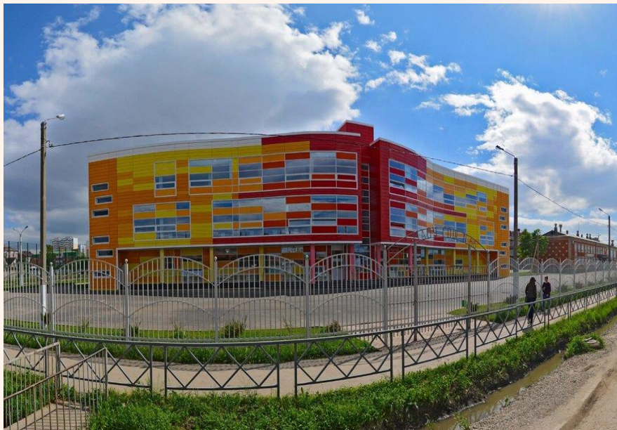
Школа № 66 им. Жени Дороша в г. Краснодаре