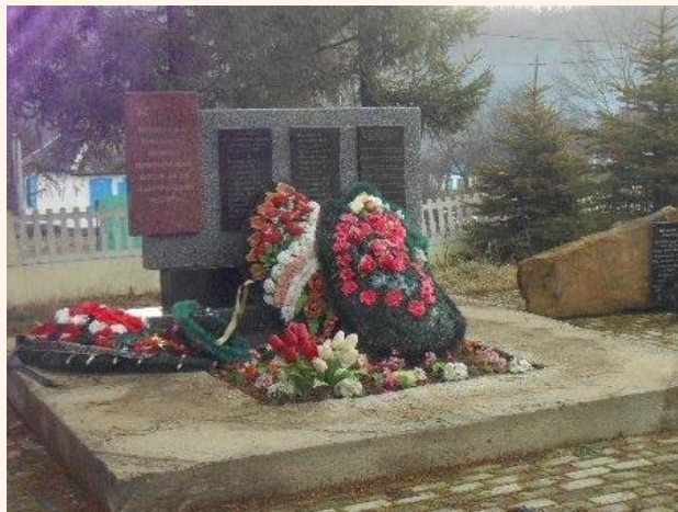
Памятник на месте гибели 27 армавирских партизан, в том числе и Эдика Ивжака в п. Новопрохладное

Эдик Ивжак похоронен в братской могиле партизан в Детском парке им. 30-летия Победы города Армавира. На месте гибели 27 армавирских партизан, в том числе и Эдика Ивжака, в посёлке Новопрохладное поставлен памятник. Материалы об Эдике Ивжаке хранятся в краеведческом музее г. Армавира и в музее боевой славы армавирской средней школы № 19. Фотография юного героя находится на памятной доске в средней школе № 5 г. Армавира.