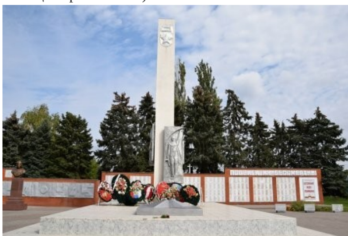
Стелла с вечным огнѣм

Памятниками архитектуры являются здание кредитного товарищества, построенное в 1909–1911 годах (сейчас в нем расположена администрация Крыловского сельского округа) и школа Варварова, которая построена в 1911 году (бывшее здание начальной школы №2 станицы Крыловской).