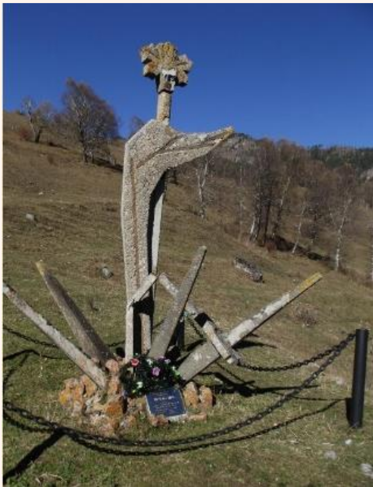
Памятник Нине Каменевой