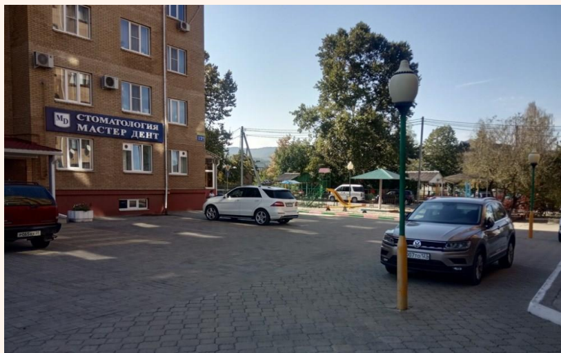
Улица Лёни Тараника в г. Горячий Ключ