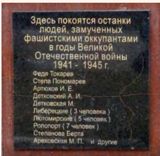
Мемориальная табличка на братской могиле

В посёлке Тульском находится памятник пионерам-героям Адыгеи. Среди надписей – имя Стёпы Пономарёва.