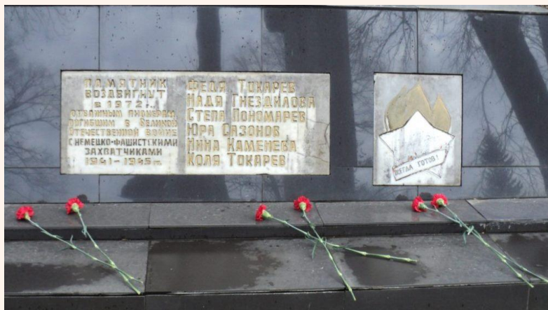
Памятник пионерам-героям в пос. Тульском