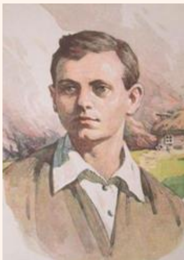
Виталий Голубятников (открытка 1969 г.)