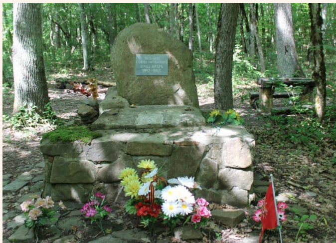
Памятный знак на месте стоянки партизанского отряда «Вихрь»