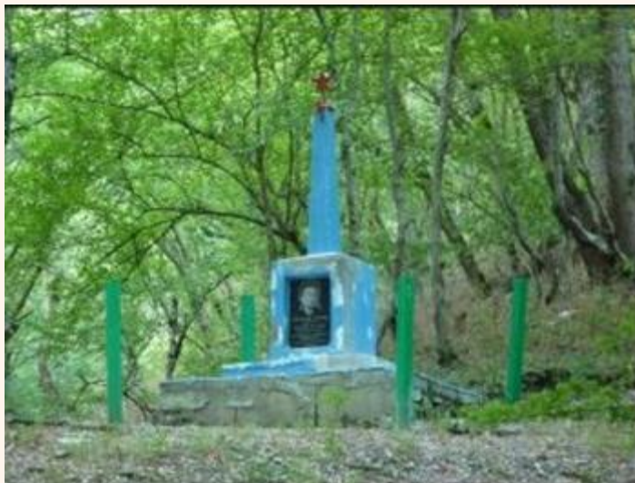
Обелиск в Лобановой щели

Толя Алёхин был похоронен на месте своей гибели в Лобановой щели. Там же в 1959 году пионеры анапской школы № 1 совершили поход по партизанским тропам и решили установить на могиле юноши обелиск. Дети сами собирали средства на памятник. В 1961 году обелиск был установлен, а рядом с памятником хранилась Книга памяти. Каждый год школьники, посещавшие это место, оставляли в книге свои записи.