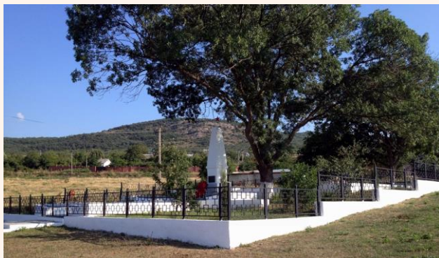
Братская могила в с. Оборонном