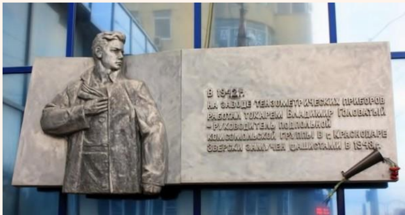
Мемориальная доска памяти Володи Головатого возле бывшего завода «Красный литейщик»