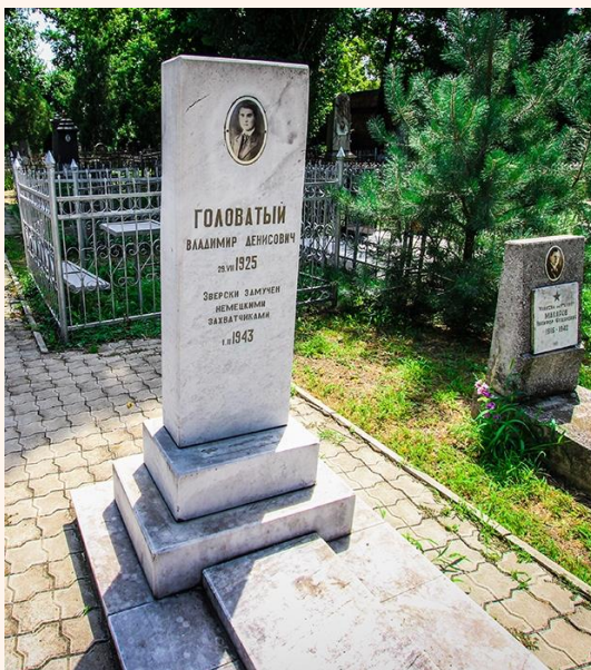
Могилა Володи Головатого

В Краснодаре именем Володи Головатого названа улица (бывшая Ярмарочная) и избирательный участок № 20-15 в Западном округе, в Детском морском центре.