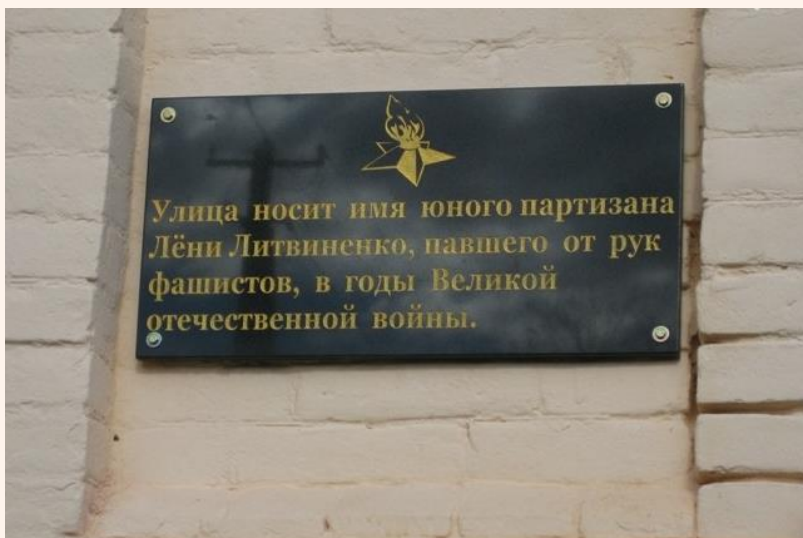
Памятная табличка на улице Лёни Литвиненко в станице Зассовская

В память о юном партизане в станице Зассовская назвали улицу.