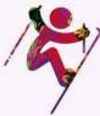
Фристайл - Хафпайп