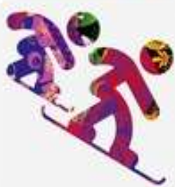
Сноуборд - кросс