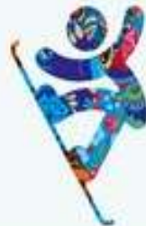
Сноуборд - Хафпайп