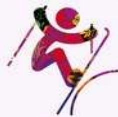
Фристайл - Слоупстайл