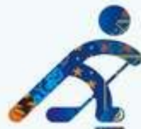
Хоккей на льду