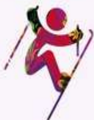
Фристайл - Хафпайп