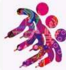
Шорт - трек