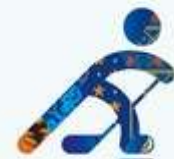
Хоккей на льду