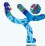
Фигурное катание на коньках