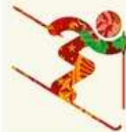
Фристайл - Могул