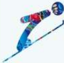
Прыжки на лыжах с трамплина