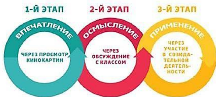
Рис. 1. Этапы проведения киноуроков

Инновационная система воспитания школьников, создаваемая в рамках Проекта, позволяет организовать воспитательный процесс в общеобразовательных учреждениях в увлекательной интерактивной форме. Современная школа, как значимый социальный институт развития подрастающего поколения, нуждается в качественном инновационном инструменте, способном сформировать в школьниках стремления к высоким идеалам, побудить к скорейшей реализации высоконравственных целей на практике.