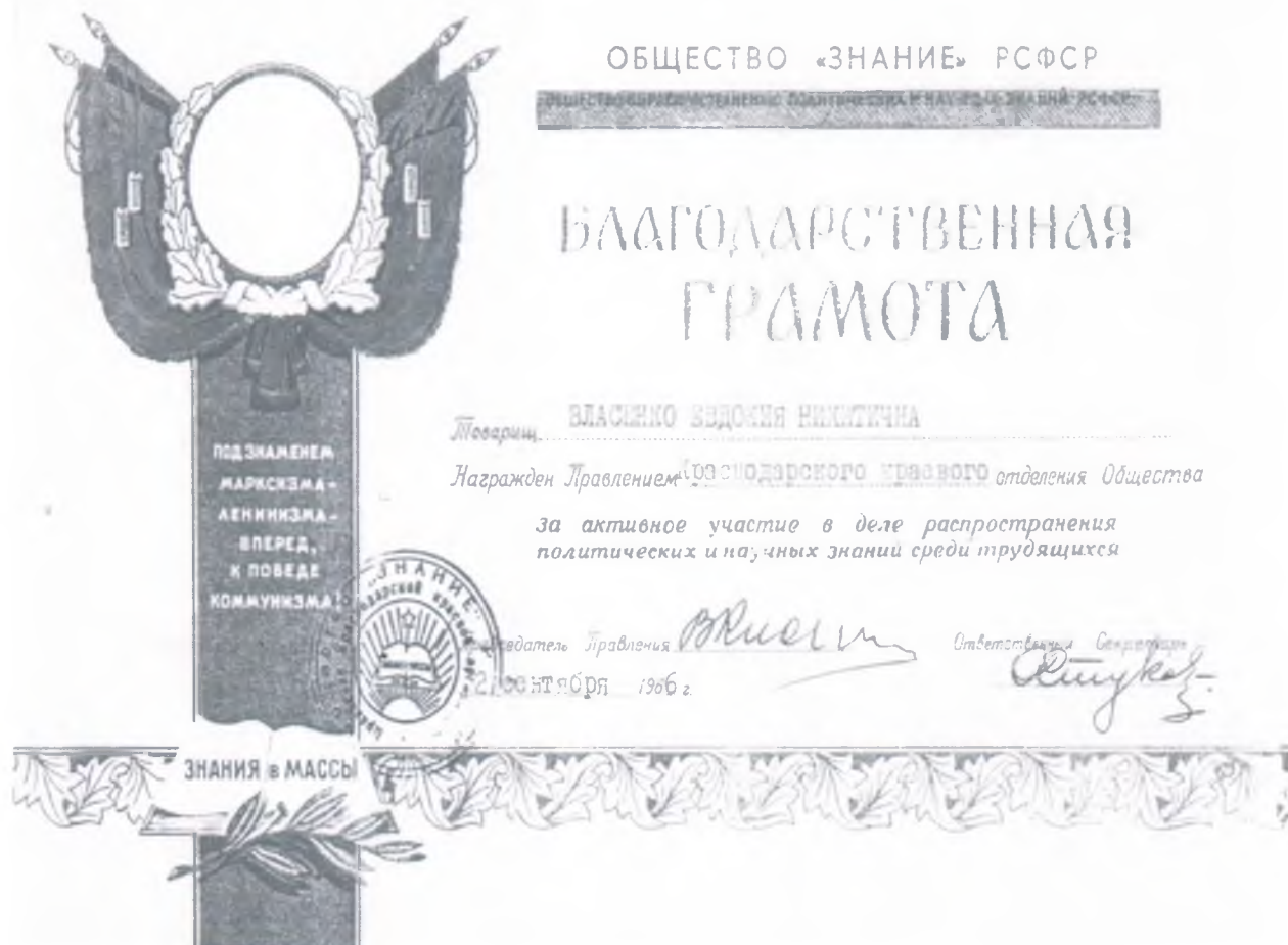
Благодарственная грамота Общества «Знание РСФСР».