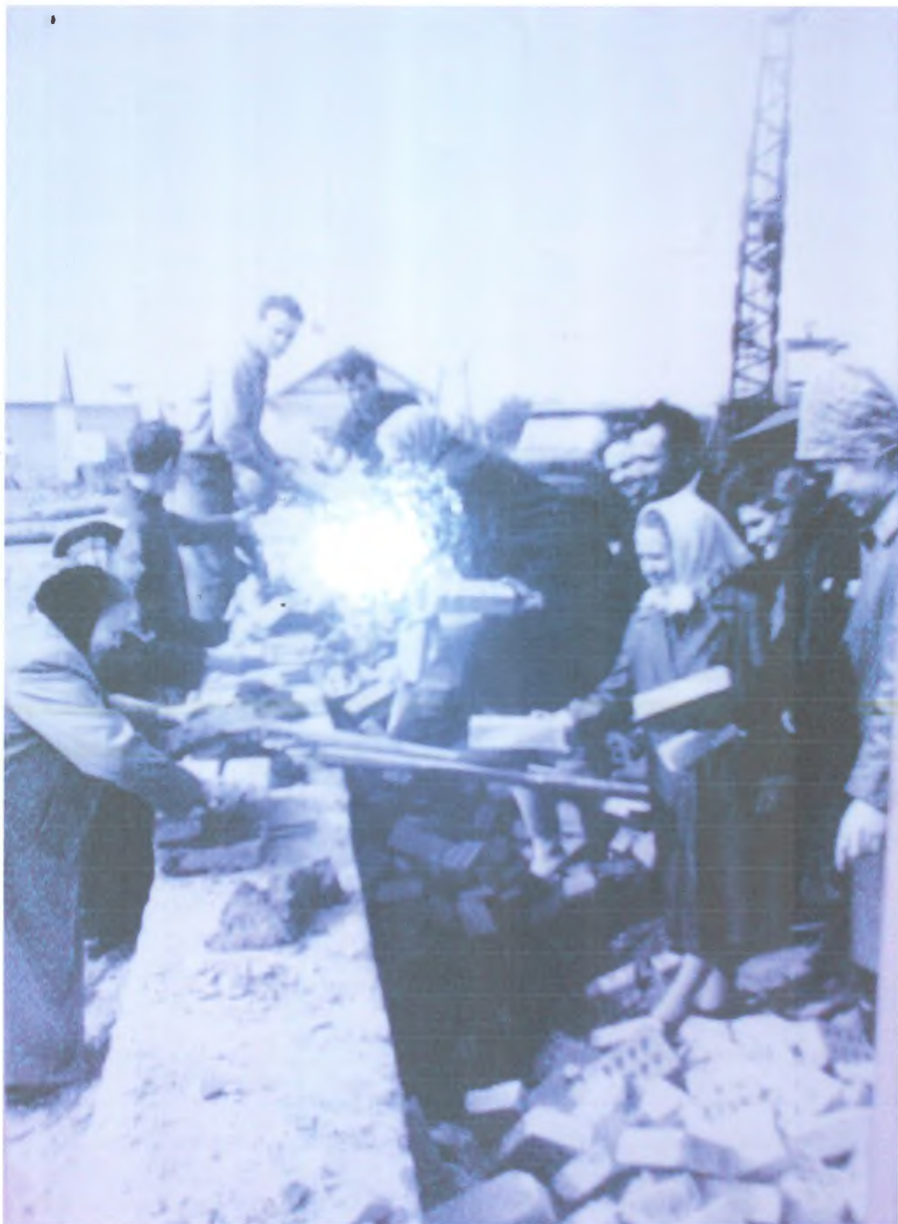
Закладка первых кирпичей строительства новой школы.