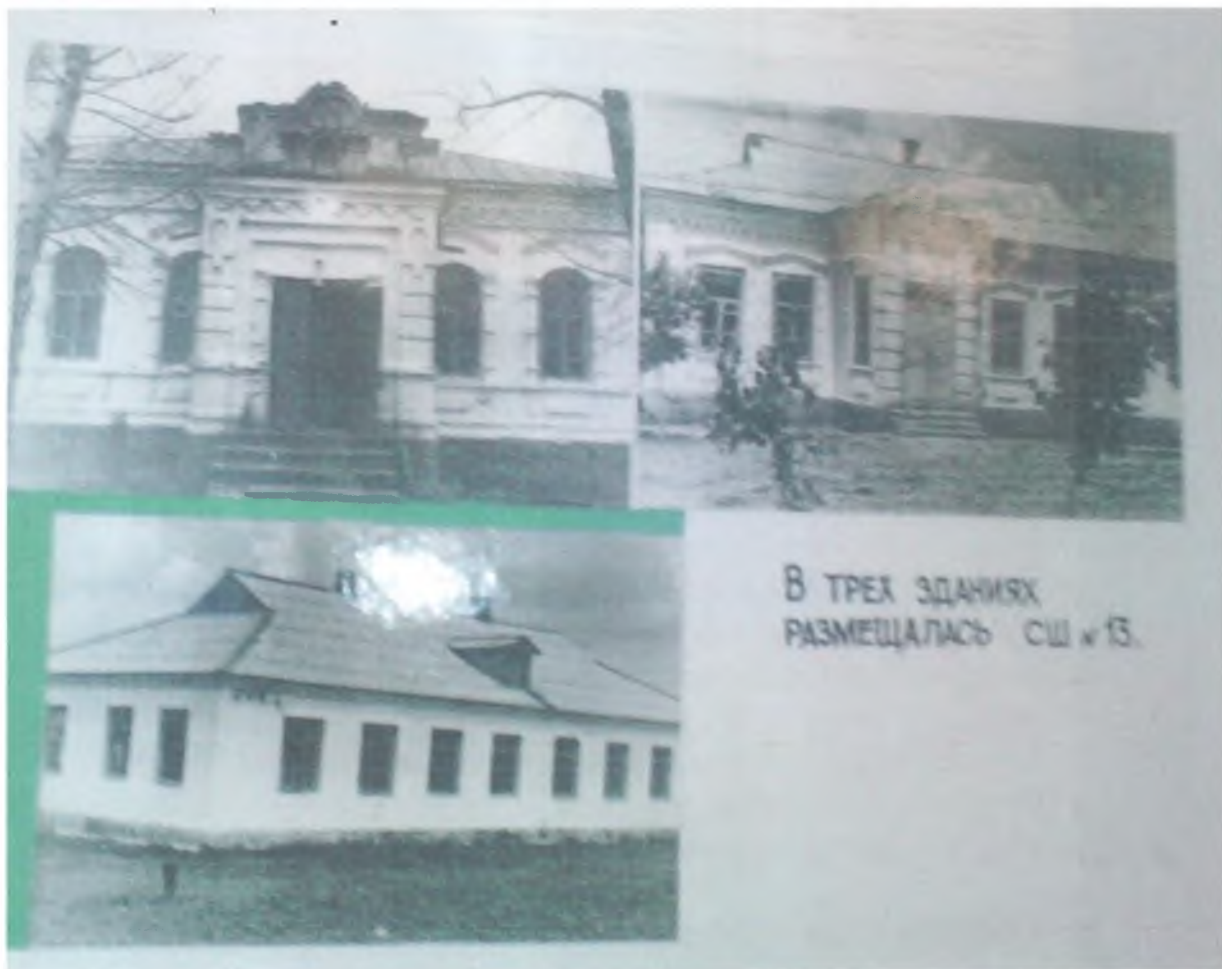
Фотографии старой школы.