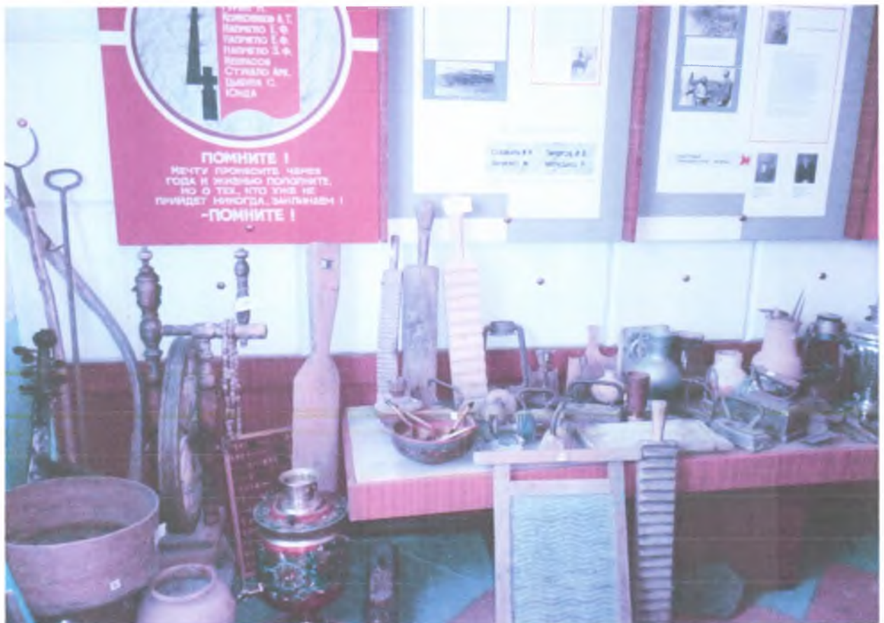
Экспозиция «Предметы быта казаков».