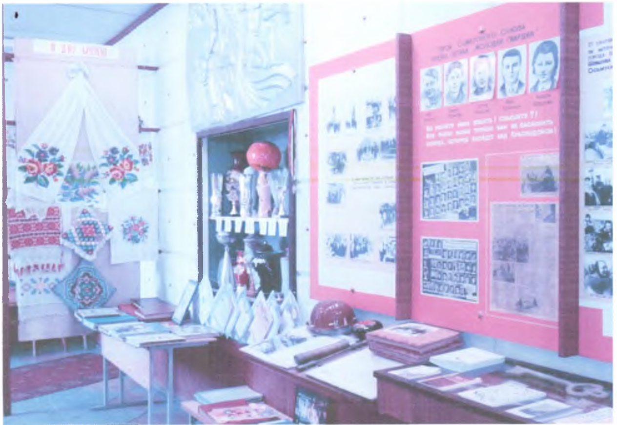
Фотографии школьного музея.