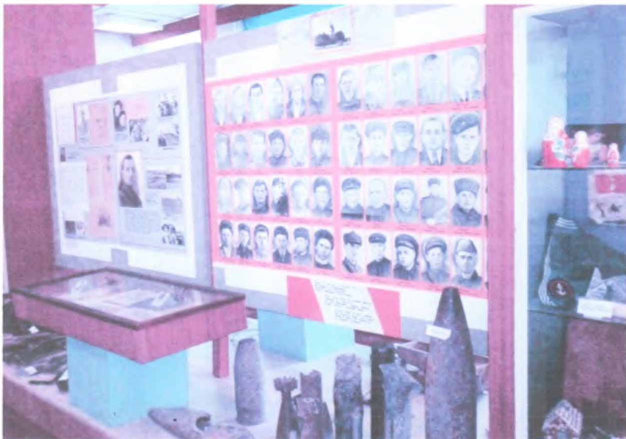
Экспозиция «Великая Отечественная война 1941-1945гг.»