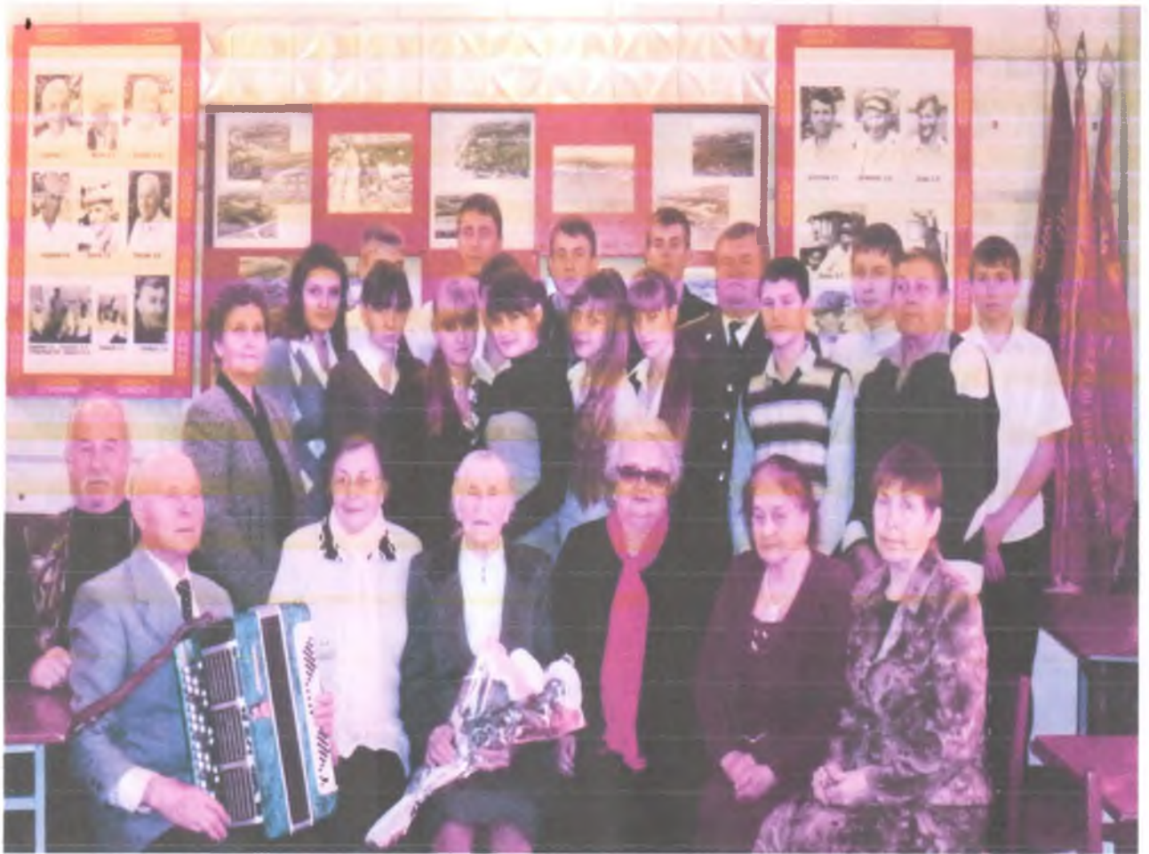
Круглый стол «Имя Твое».