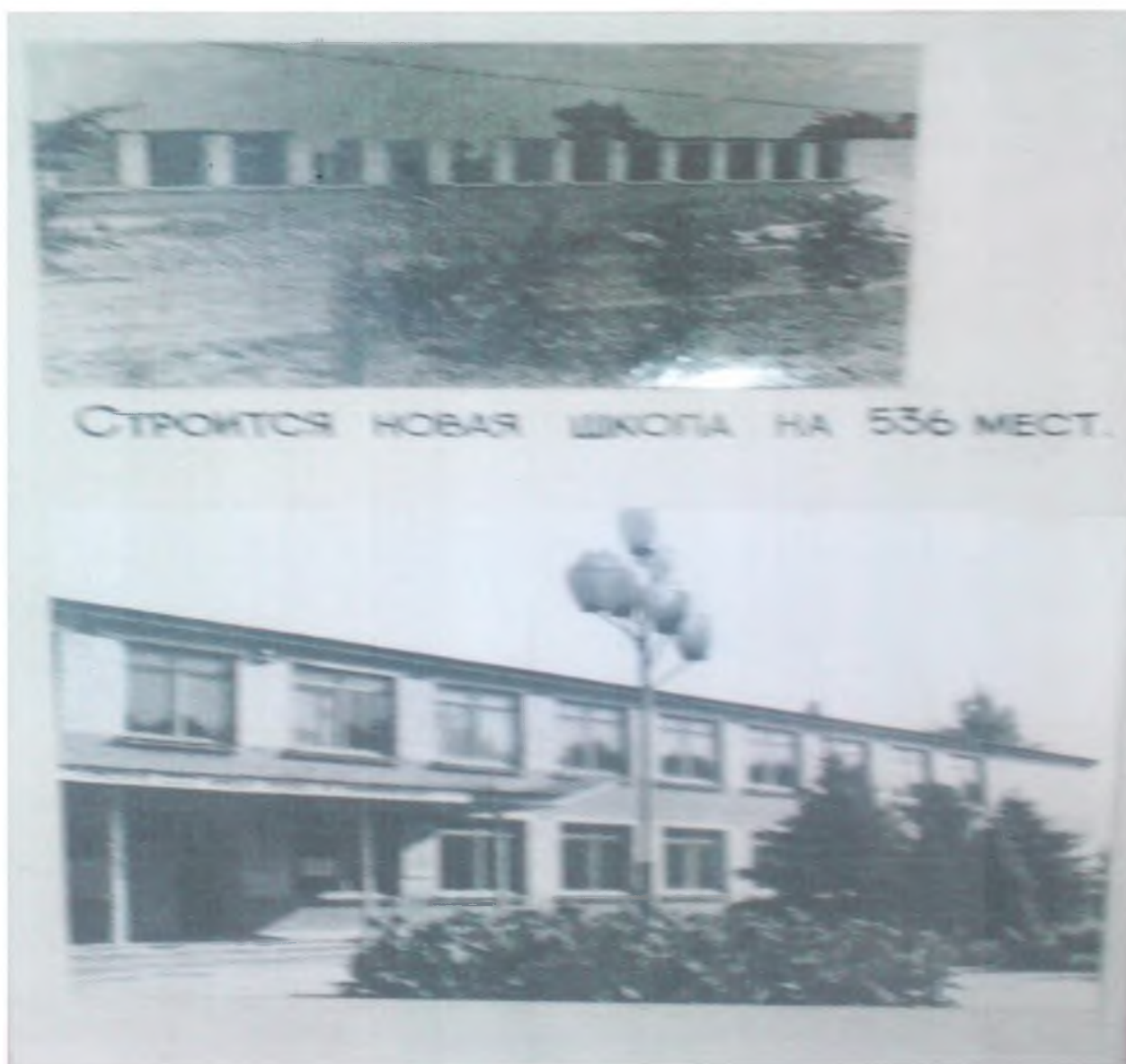
Новая школа, 1970 год.