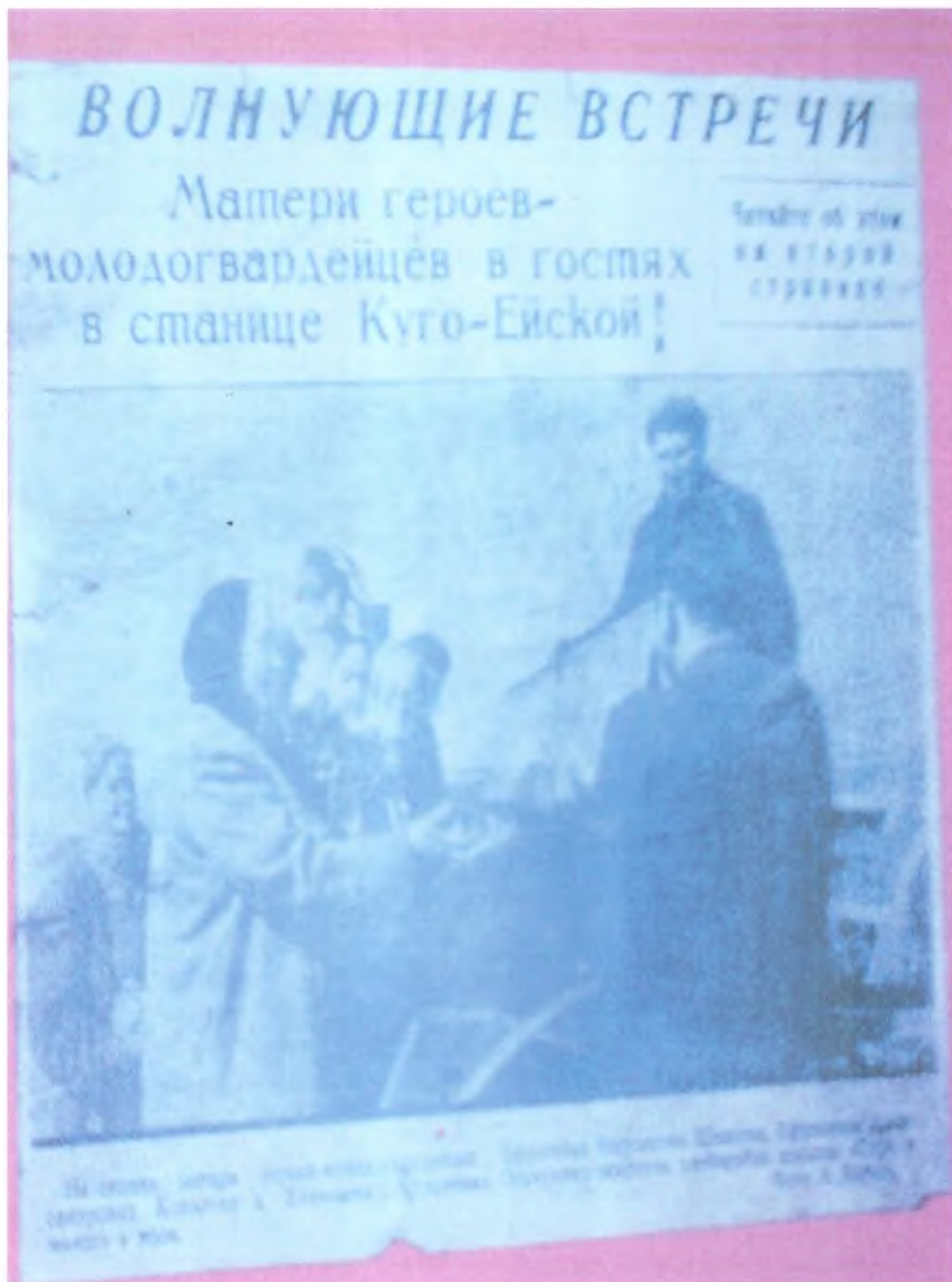
Статья в газете «Волнующие встречи».