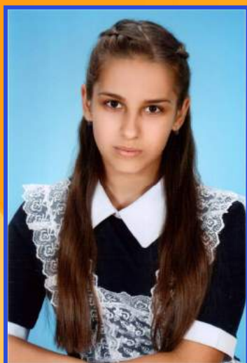
Ответственный редактор Кульгавова Дарья