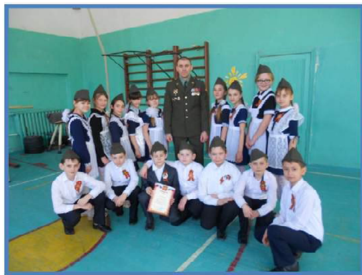
Смотр строя и песни 4 класс

Конкурс «Смотр строя и песни» посвящен Дню защитника Отечества. Компетентное жюри оценило: внешний вид, правильность и четкость выполнения команд, строевой шаг, исполнение песни и действия командира. По итогам конкурса были вручены грамоты. Каждый участник показал ответственность, умение слаженно работать в команде, готовность встать на защиту Родины.