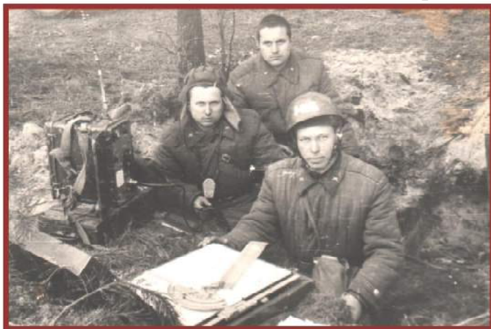
Дедушка с боевыми товарищами

солдаты разных национальностей: русские, казахи, узбеки, литовцы, белорусы, но между собой они общались на русском языке, так как служили в Советской Армии.