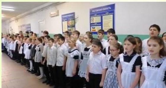
с. 2 Всё начинается с детства