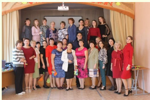
с.12 «Учитель! Перед именем твоим...»