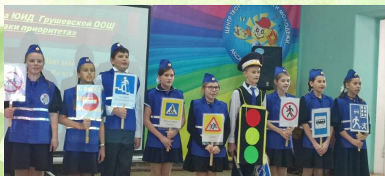
с. 16 Школьные новости

Школа – это страна детства. В этой стране мы учимся уважать человека и самих себя, учимся разбираться в пестрой и бурной путанице мыслей, чувств, событий. Задача каждого из нас помочь сверстникам наполнить свои сердца чувствами любви и добра к миру.