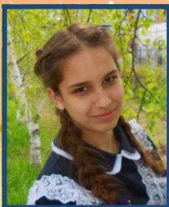
Ответственный редактор Кульгавова Дарья