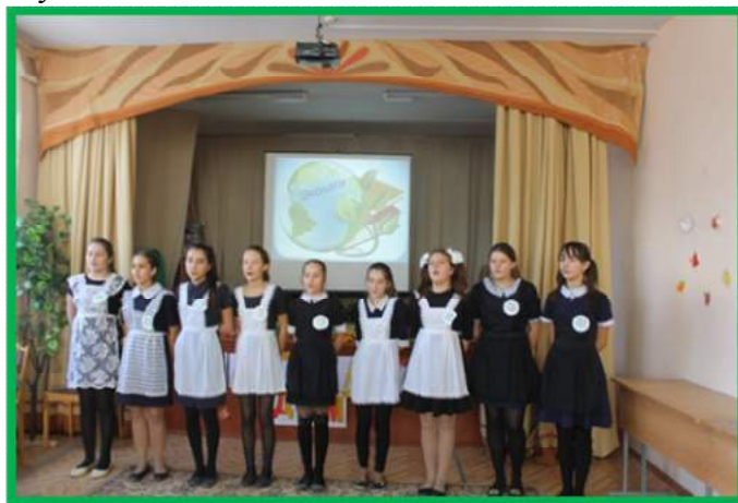
Экологический КВН 7 класс