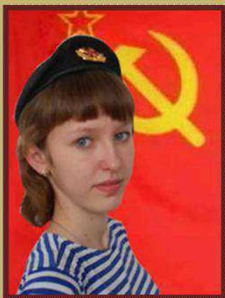
Ответственный редактор Потемкина Алина