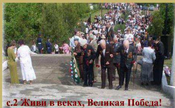
с.2 Живи в веках, Великая Победа!