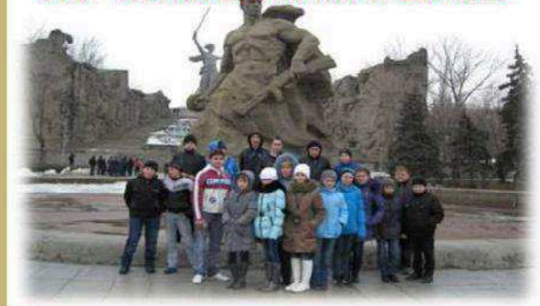
с. 6 Не гаснет памяти свеча...