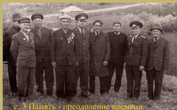
с. 3 Память - преодоление времени