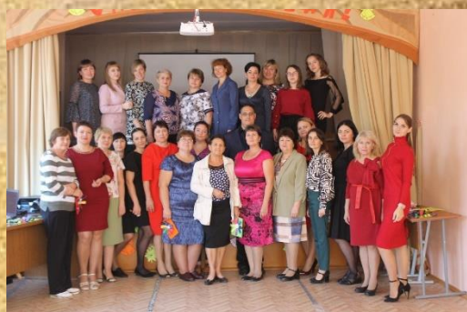
с. 2 Прозвенит звонок веселый