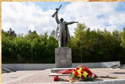
с. 6 Не гаснет памяти свеча