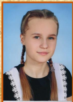
Ответственный редактор Бережная Виктория