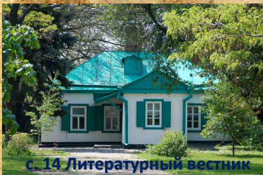
с. 14 Литературный вестник

Человек начинается с детства. Именно в детстве происходит посев добра. «Годы детства – это прежде всего воспитание сердца», - утверждал В.А. Сухомлинский.