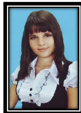
Ответственный редактор Смелова Кристина