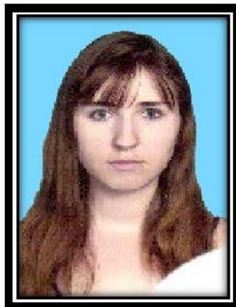
Дизайн и оформление - ст. вожатая Н.А. Чечина