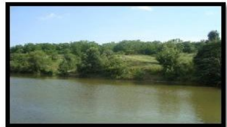
Слова: Т.А. Черковой Музыка: А.П. Корнеева

Ивушка плакучие да луга прибрежные Разлюбезной Родине чувства мои нежные.