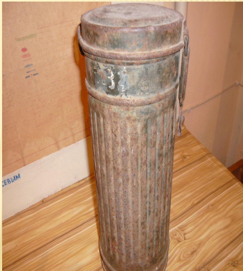
АВИАЦИОННАЯ БОМБА И ТЕРМОС ДЛЯ ПАТРОНОВ.