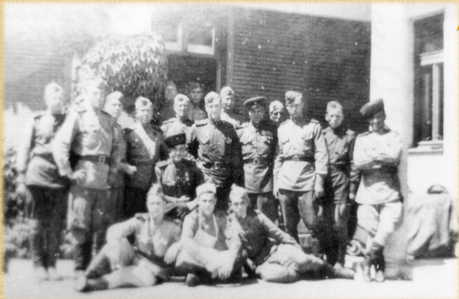
Чехословакия 1944 год.