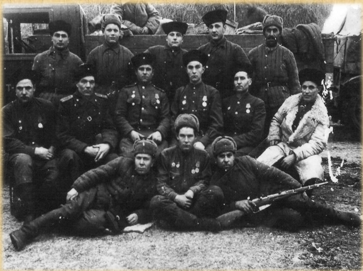
Венгрия 1945 год