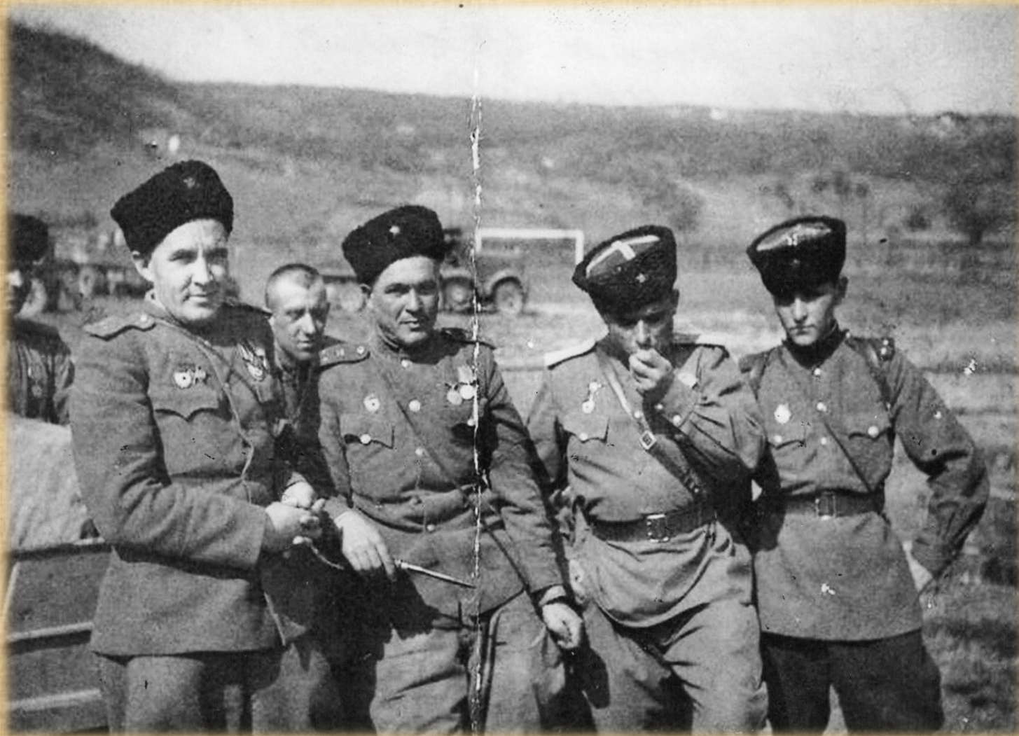
Апрель 1944 год. Освобождение Одессы.