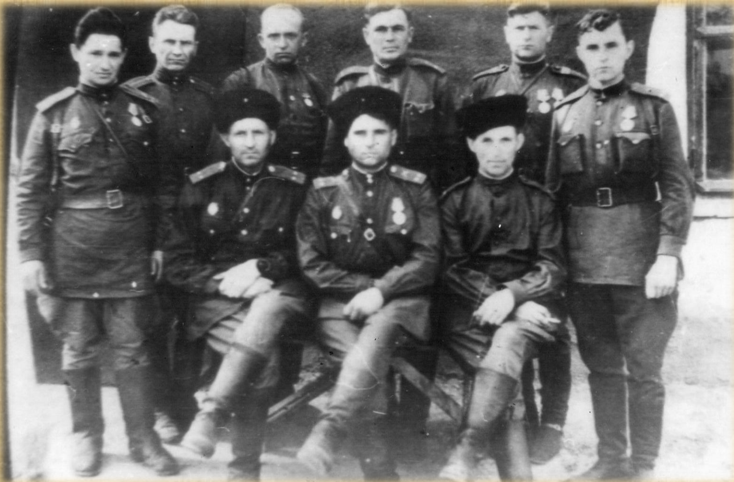
Польша 1944 год.