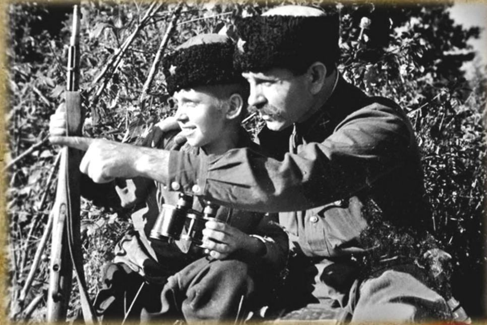
Кубанские казаки-добровольцы на фронте

В героике ратных подвигов, совершенных советскими войсками в годы минувшей войны, ярким самоцветом сверкает воинская доблесть 4-го гвардейского Кубанского казачьего кавалерийского корпуса. Когда осенью 1941г. немецко-фашистские полчища нависли над югом страны. На Кубани поднялась новая волна патриотического движения. Это отцы и деды, и все те, кто ещё не был призван в армию, сами себя объявили мобилизованными и заявляли о неукротимом стремлении идти добровольцами на фронт.