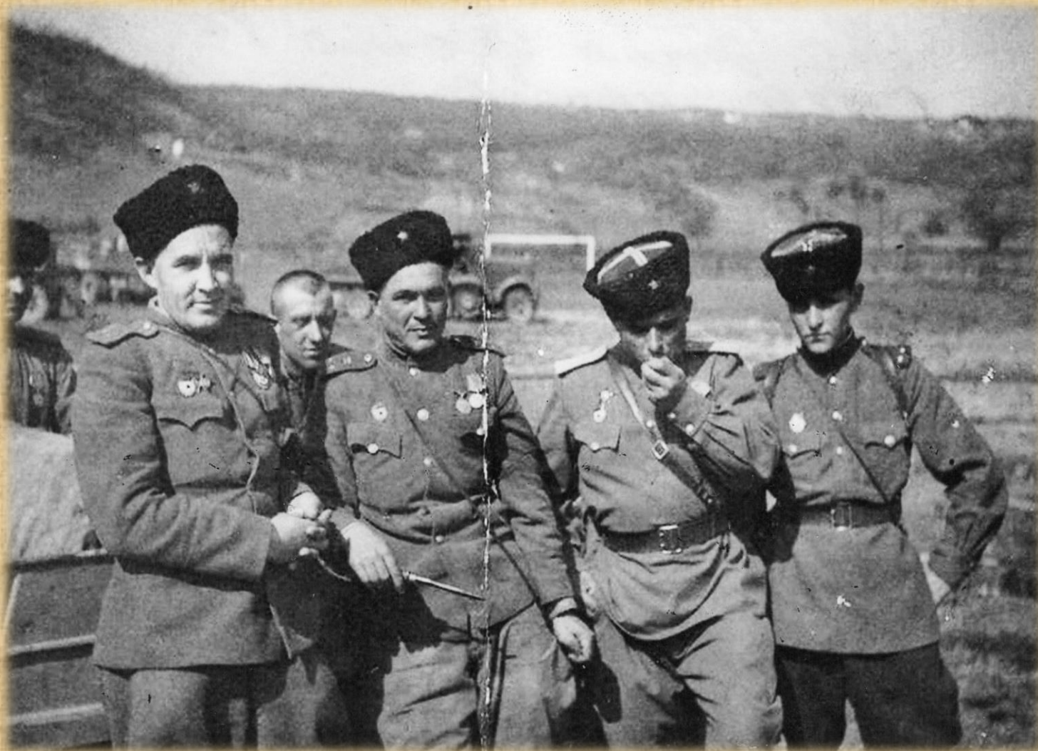
Апрель 1944 год. Освобождение Одессы.