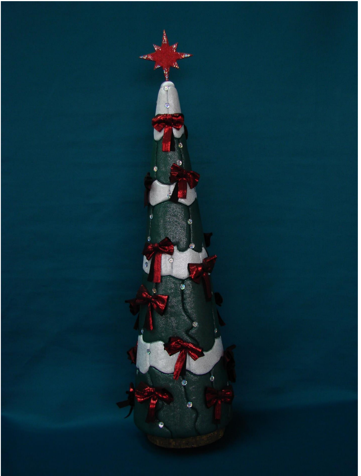
Новогодняя Елочка в технике «Кинусайга»