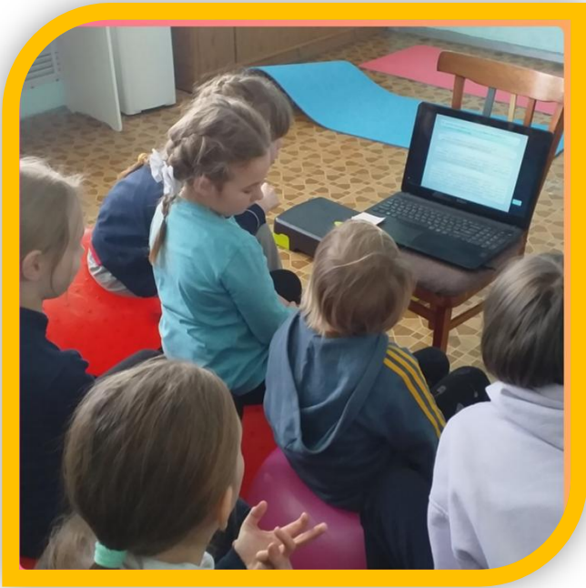
Просмотр видеороликов антинаркотической направленности