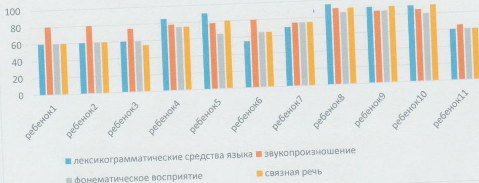
Конец 2019-2020 учебного года