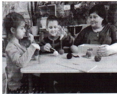
Рис.1-Использование дидактического набора «Дары Фрёбеля» на логопедических занятиях