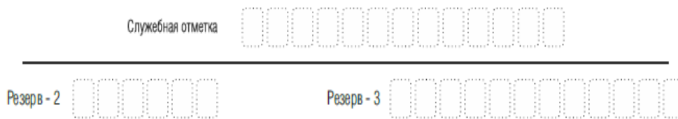
Рис. 5. Поля для служебного использования

Заполнение полей (рис. 6) организатором в аудитории обязательно, если участник экзамена удален с экзамена в связи с нарушением Порядка или не завершил экзамен по объективным причинам. Отметка заверяется подписью организатора в специально отведенном для этого поле бланка регистрации, и вносится соответствующая запись в форме ППЭ-05-02 «Протокол проведения экзамена в аудитории».