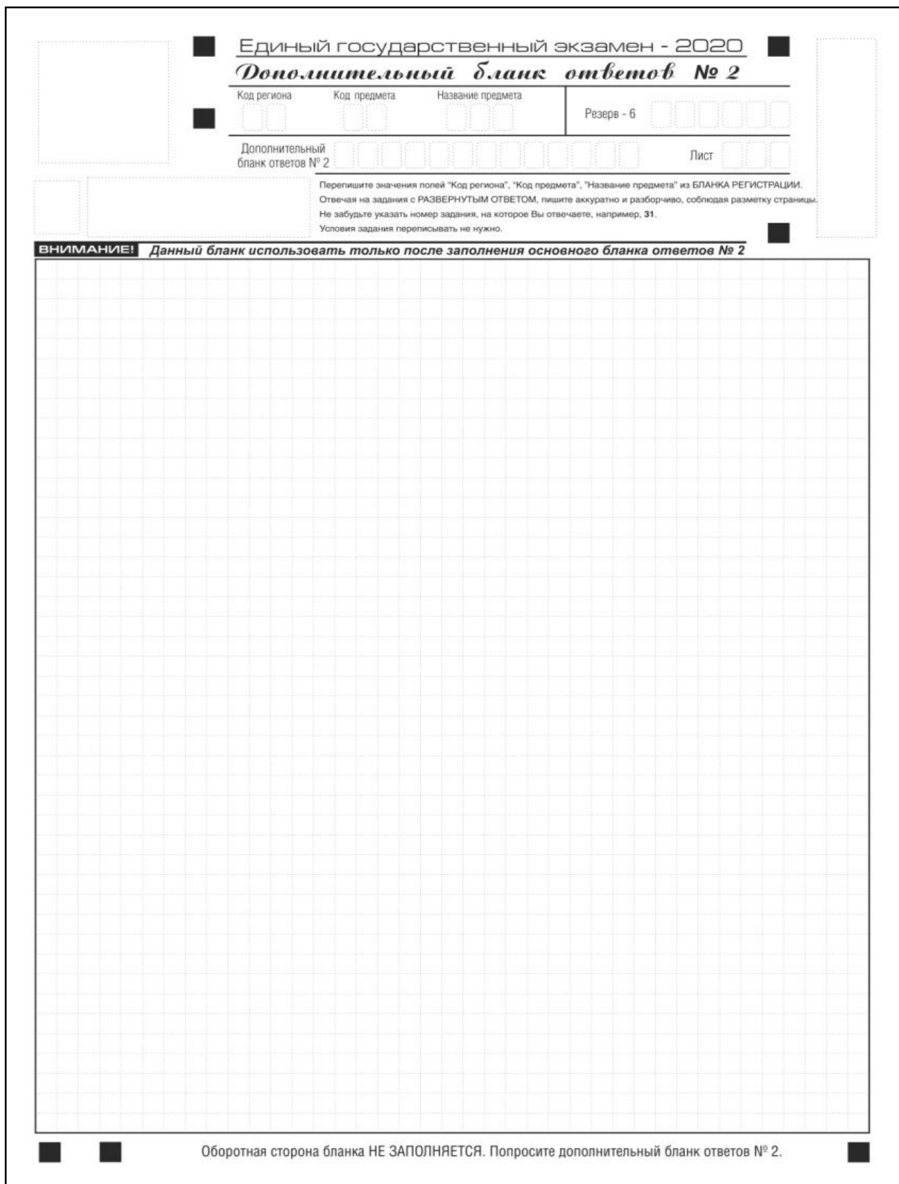
Рис. 15. Дополнительный бланк ответов № 2