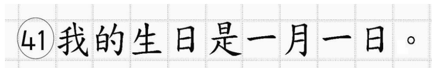
Рис.14. Образец написания иероглифических знаков

иероглифический знак и каждый знак препинания следует писать внутри отдельной клетки области ответов бланка ответов № 2 (дополнительного бланка ответов № 2) (рис. 14).