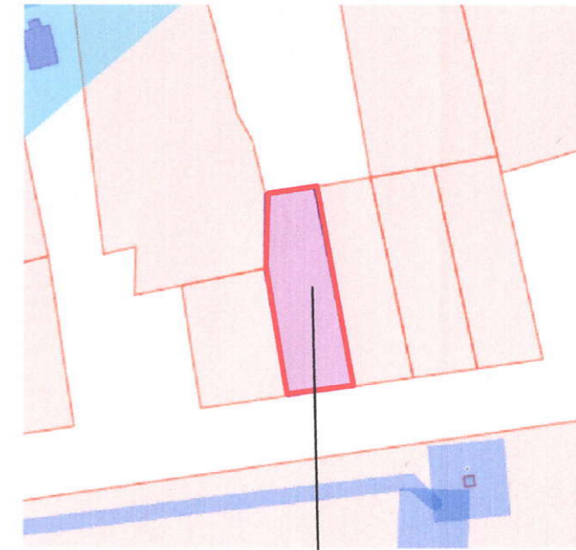
Земельный участок с КН 23:24:0803001:596