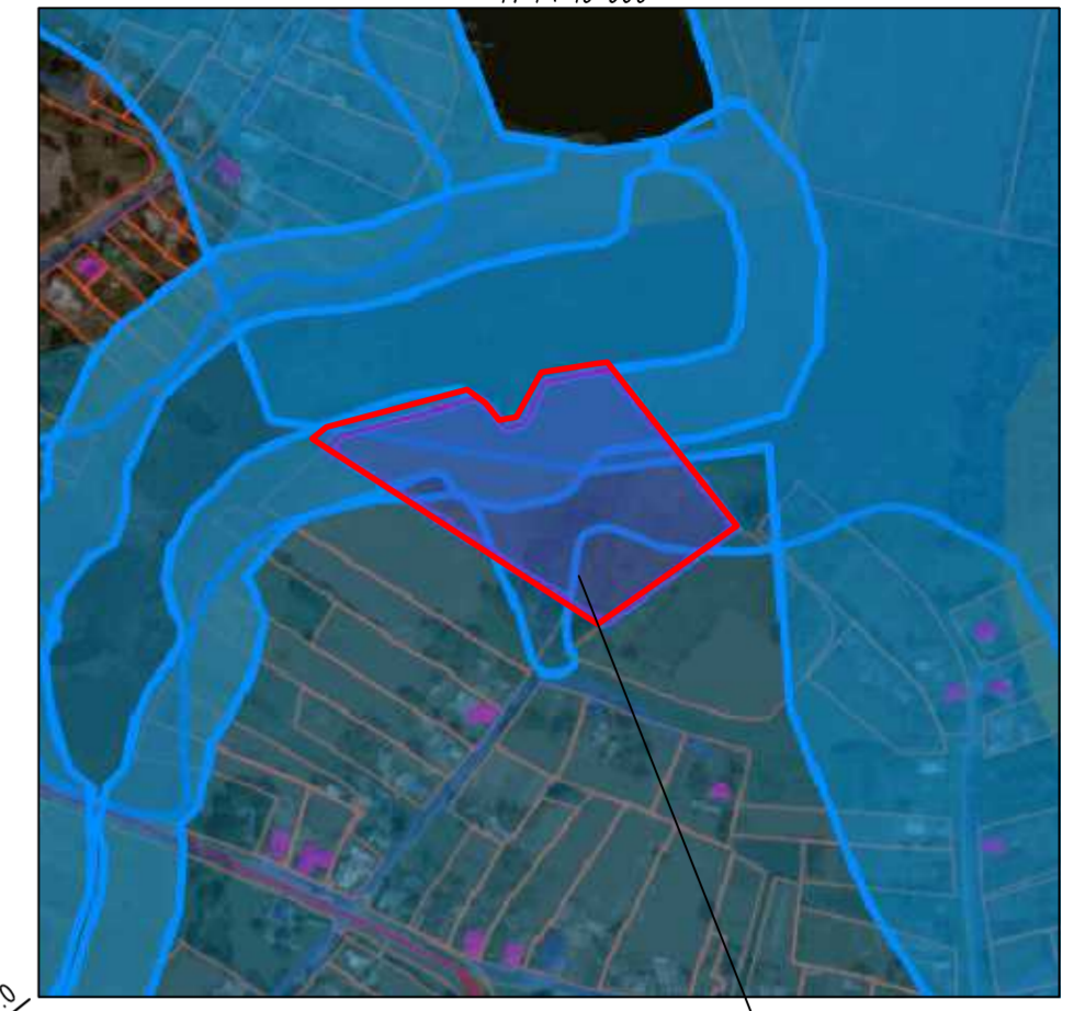
Земельный участок с КН 23:24-0902102:370