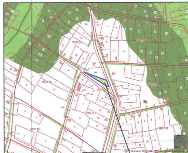
Земельный участок с КН 23:24:0902105:350