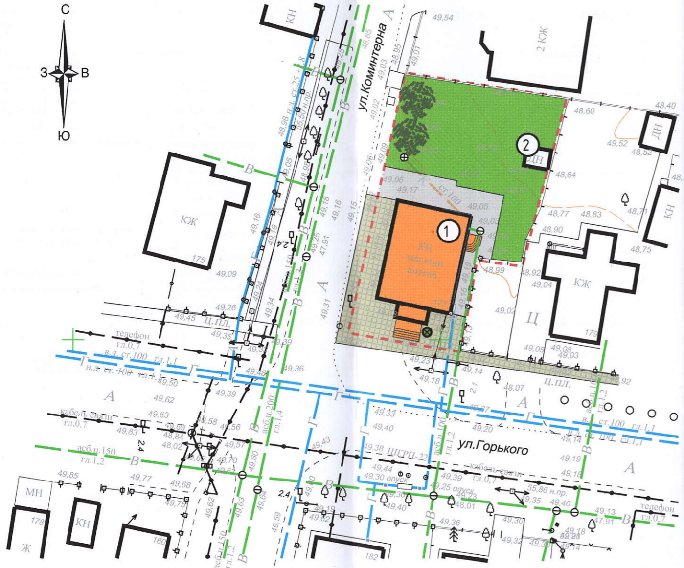
СХЕМА ПЛАНИРОВОЧНОЙ ОРГАНИЗАЦИИ ЗЕМЕЛЬНОГО УЧАСТКА