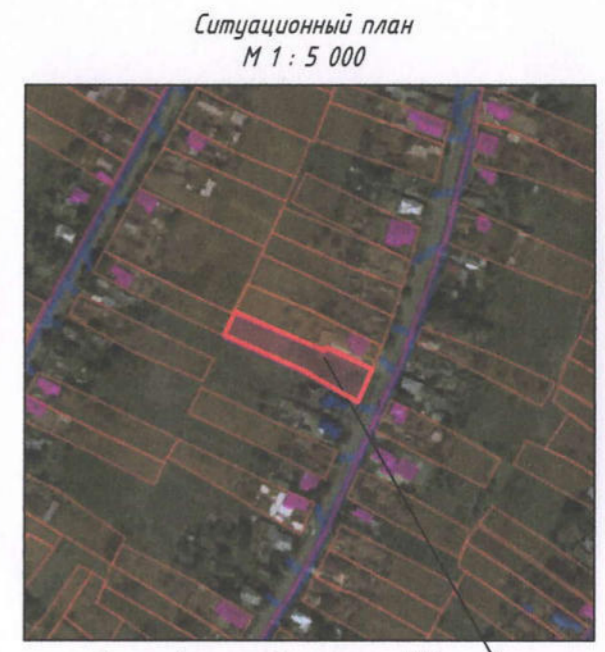
Земельный участок с КН 23:24:1002049:500