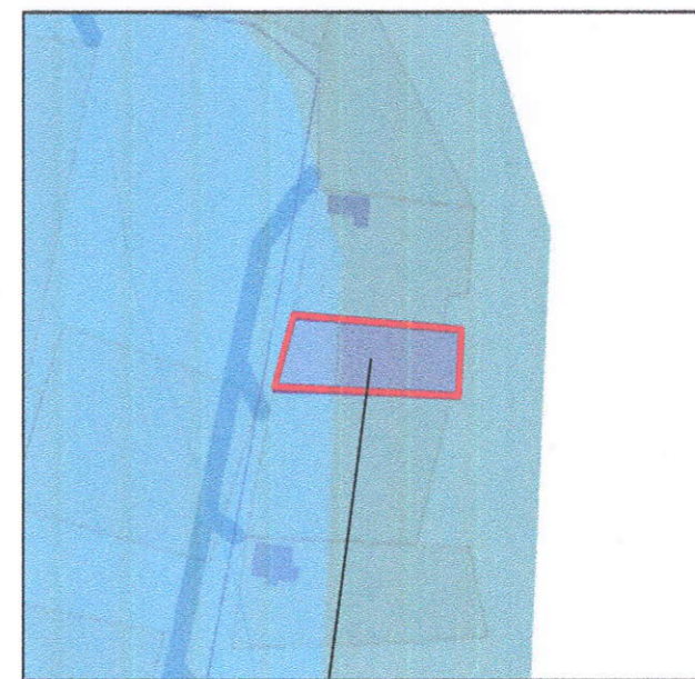
Земельный участок с КН 23:24:0102017:4:29