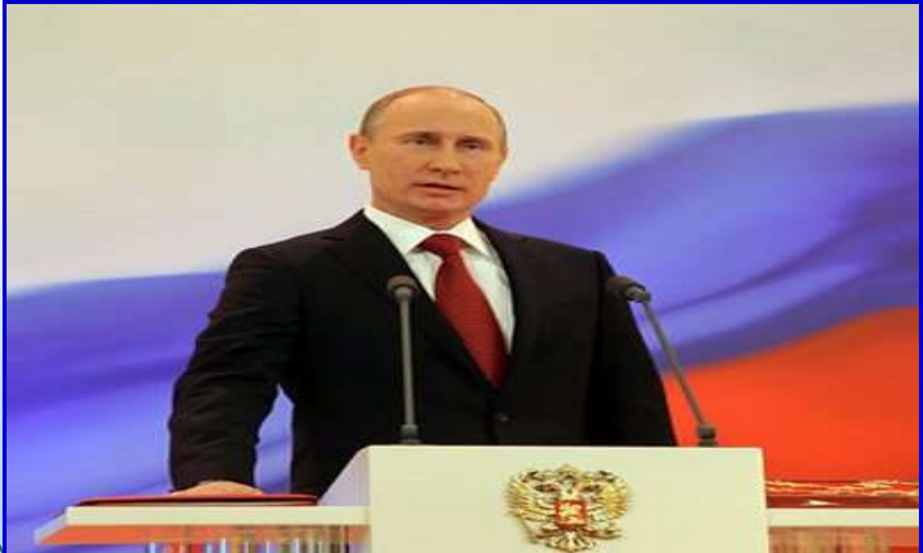
Президент Российской Федерации В.В. Путин