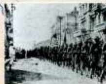
Американские интервенты во Владивостоке, 1918 г.