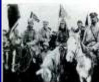
Бойцы 1-й Конной армии