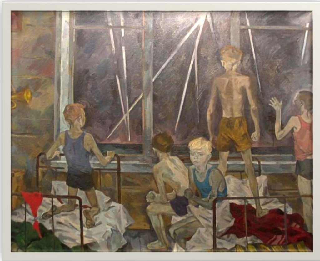
Андрей Суровцев «Дети войны», 1985 г.