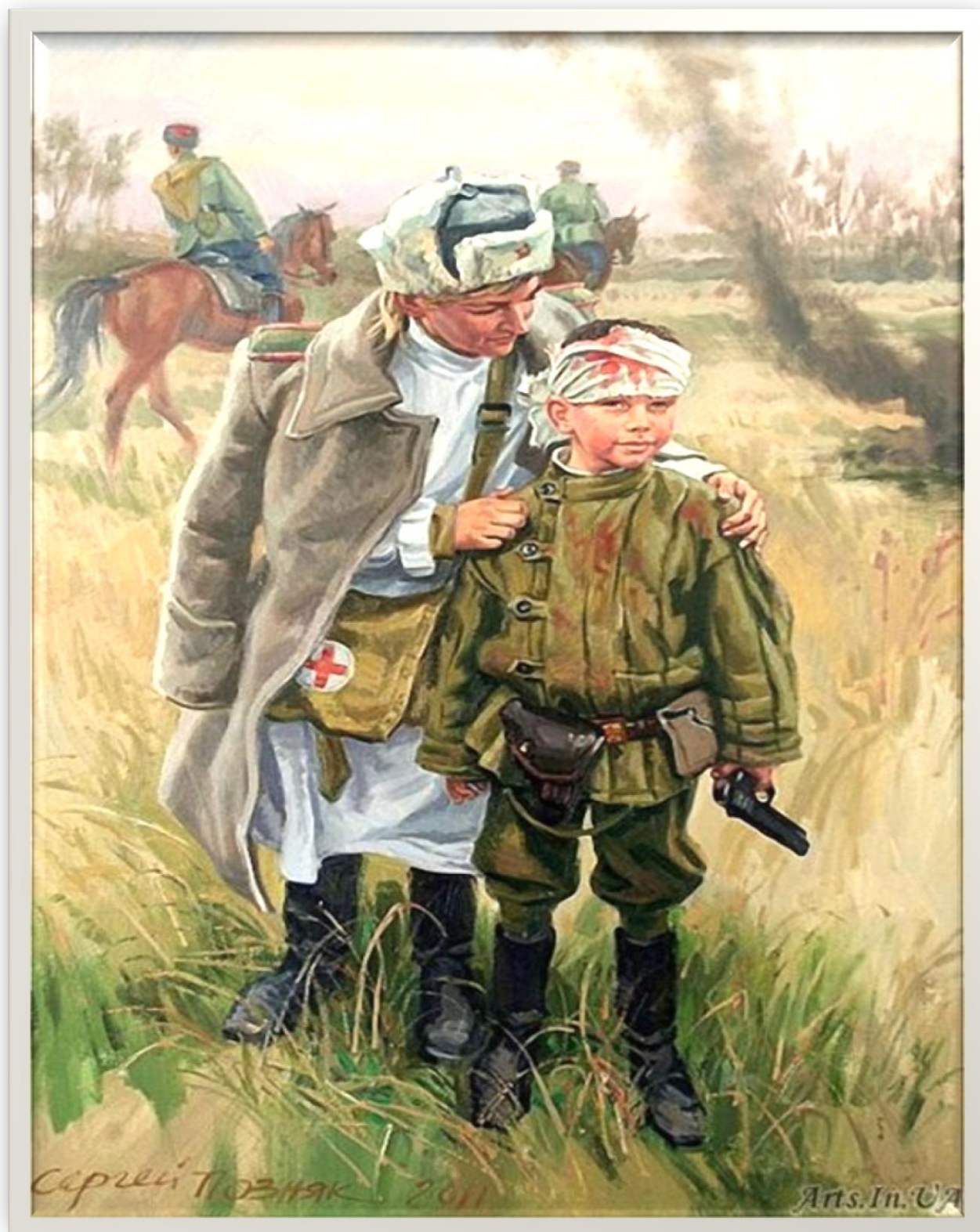
Сергей Позняк «Сын полка. После боя», 2011 г.