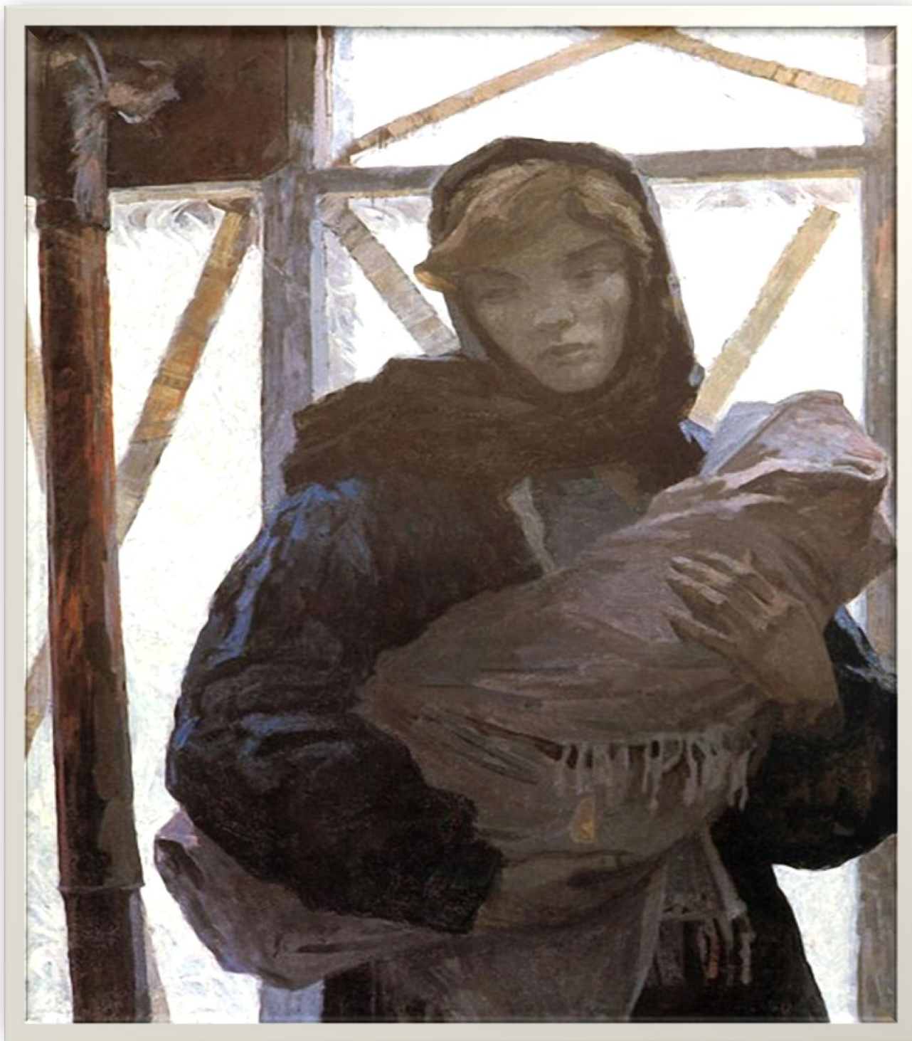
Михайлов А.С. «Тревога (Колыбельная)», 1965 г.