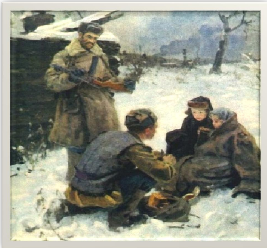
Федор Савостьянов «Душа солдата».