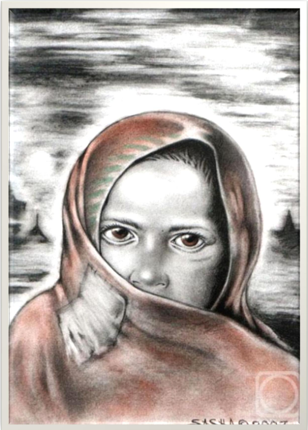
Александр Николаевич Климин «Война...», 2007 г.