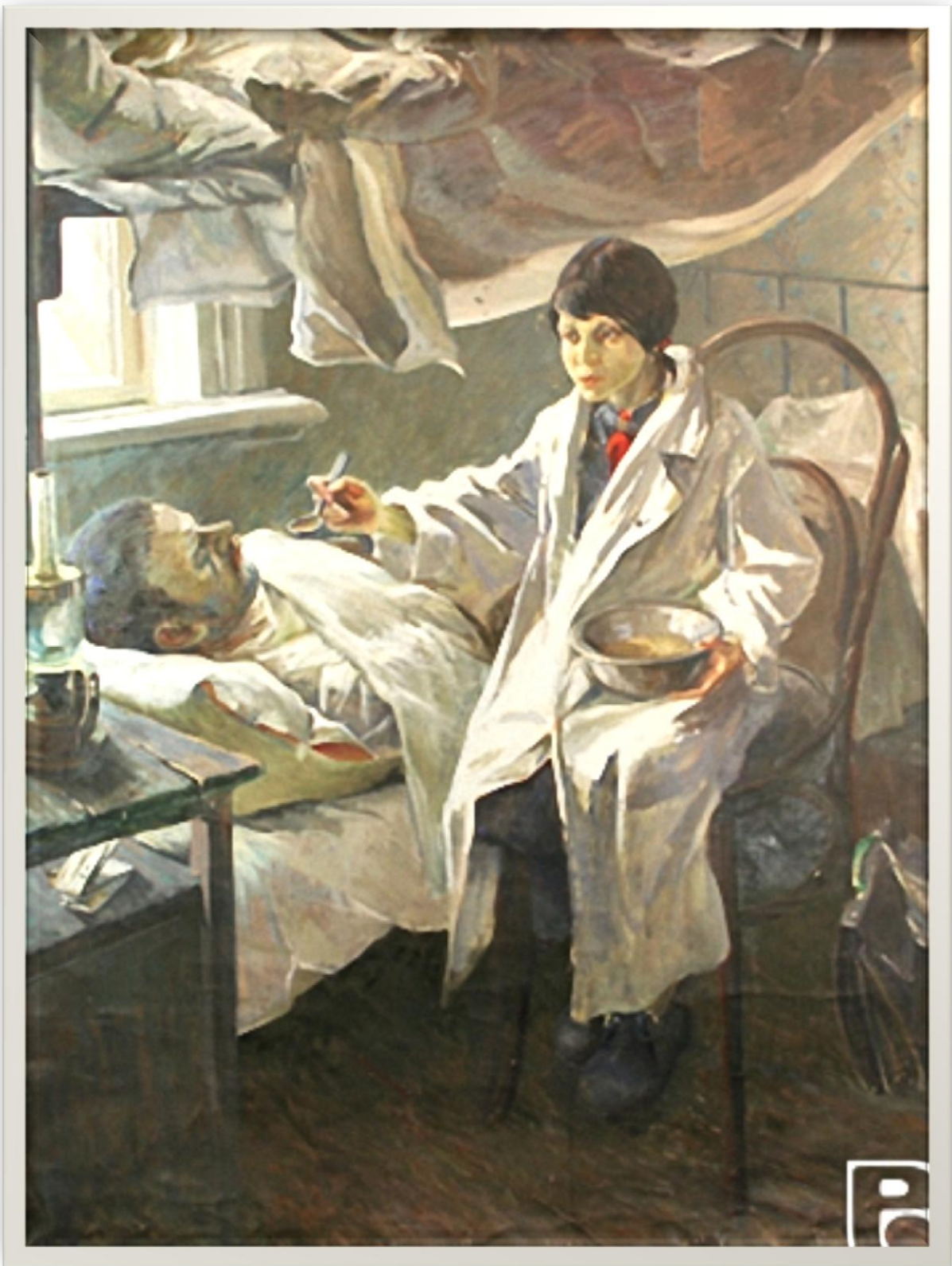
Олег Иванович Гойдин (род. 1937) «Нянюшка».