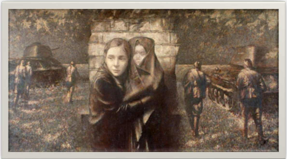
Сергей Кириллович Дергун (род. 1951) «В годы войны», 1985 г.