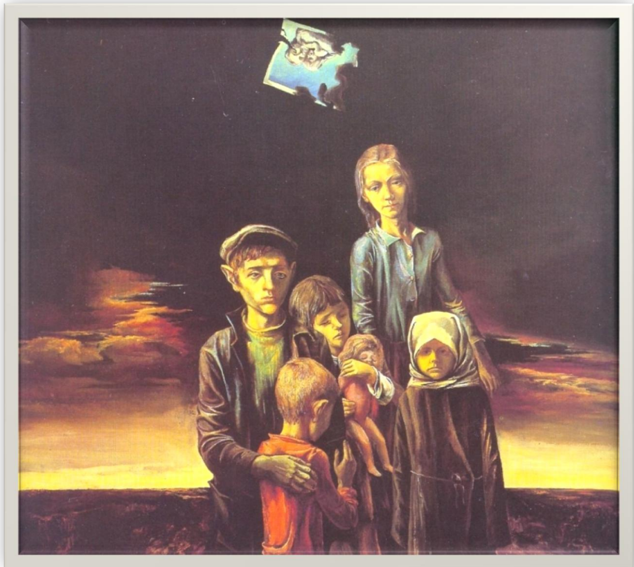
Картина Эдуарда Белогурова «Дети войны»