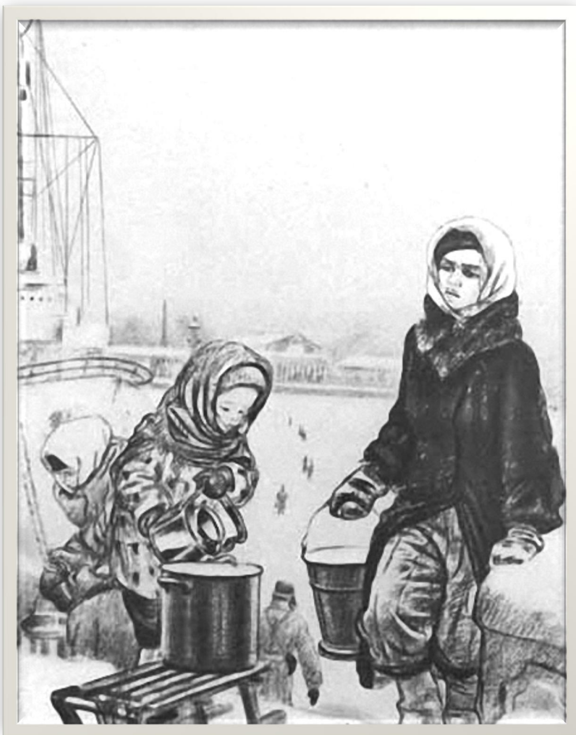
А. Пахомов «На Неву за водой». Из серии "Ленинград в дни блокады".