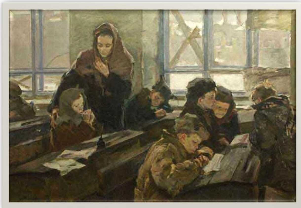
Ольга Башкевич «Первый урок в 1944 году», 1967 г.