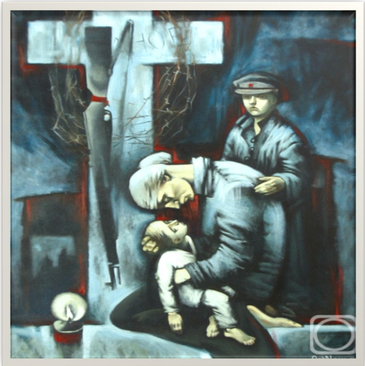
Александр Евгеньевич Тюнькин (род. 1986) «Аджимушкайская мадонна», 2009 г.