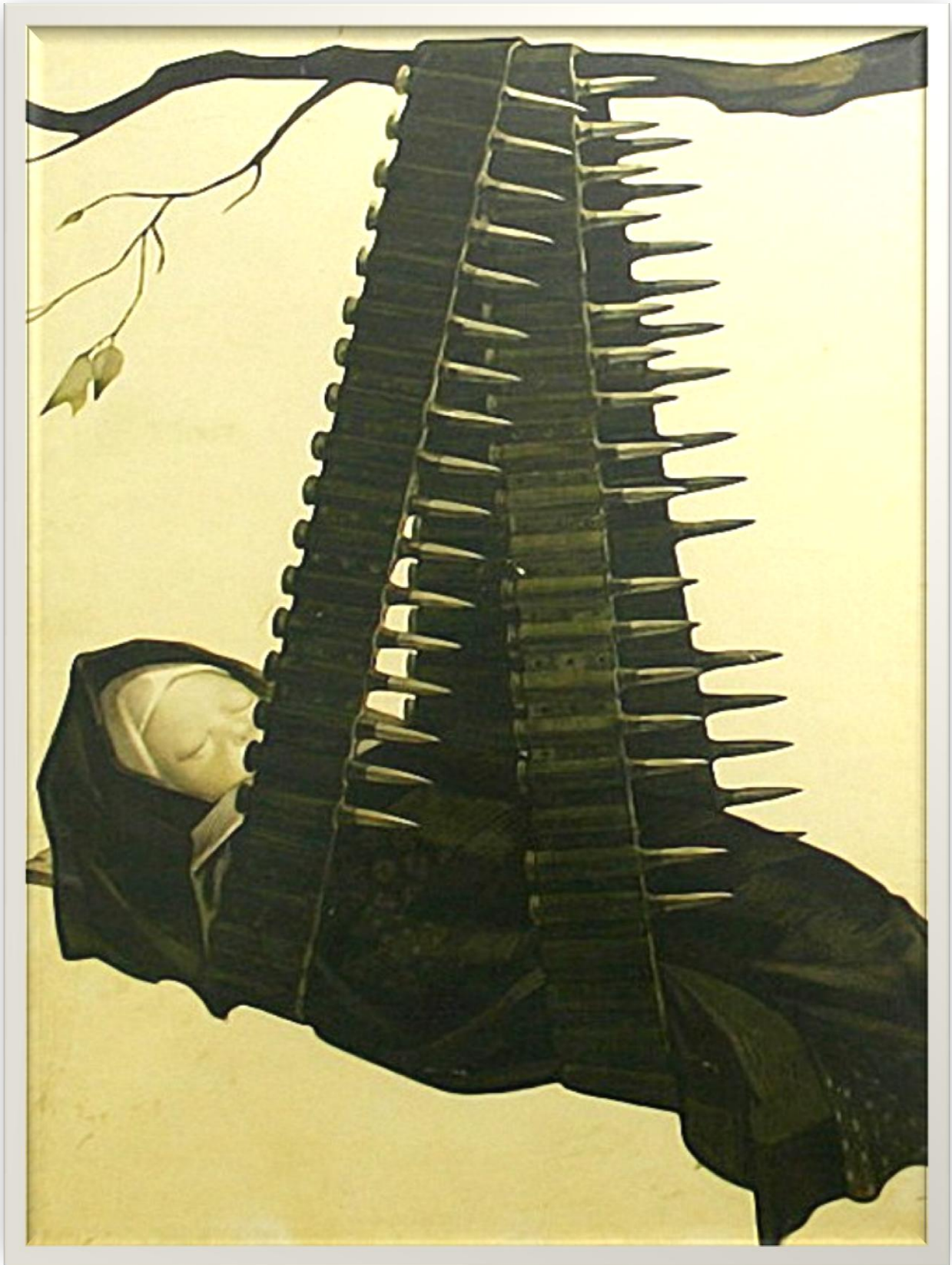
Виктор Корецкий «Партизанская колыбельная», 1960 г.