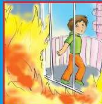
Если выйти невозможно, найти источник свежего воздуха, выбраться на балкон