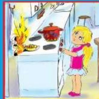
Газовые и электроплиты