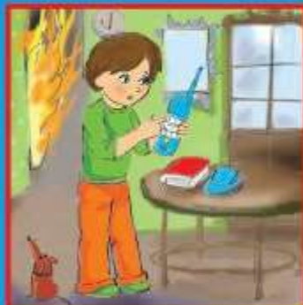
Вызвать пожарных по телефону 01