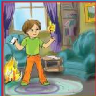
Неосторожное обращение с огнем