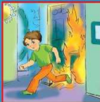
Если потушить невозможно, срочно покинуть помещение