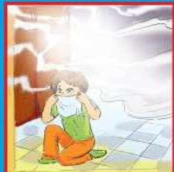
В задымленном помещении дышать через мокрую ткань