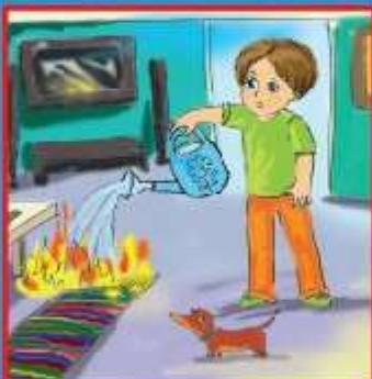
Мелкое возгорание потушить подручными средствами