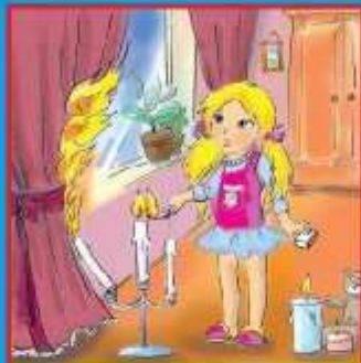
Игры с огнем