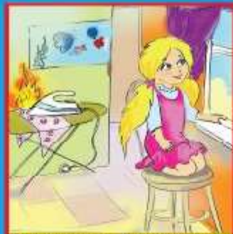
Оставленные без присмотра электроприборы