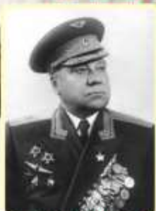
ЛЯПИДЕВСКИЙ АНАТОЛИЙ ВАСИЛЬЕВИЧ