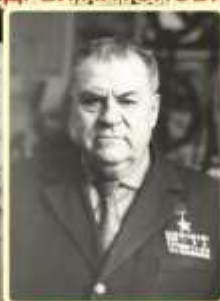
КОРОЛЕНКО ГРИГОРИЙ ФЕДОТОВИЧ