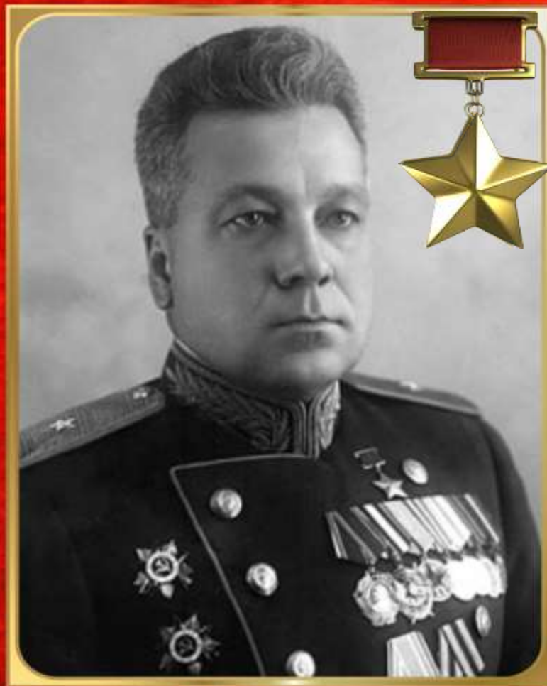
ЛЯПИДЕВСКИЙ АНАТОЛИЙ ВАСИЛЬЕВИЧ первый Герой Советского Союза