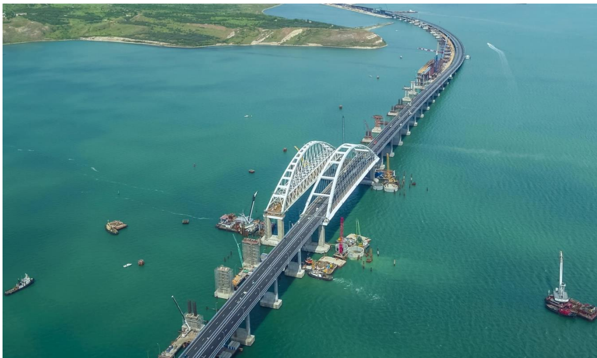
Строительство моста в Крыму

Задание 1. Рассмотрите фото Крымского моста.