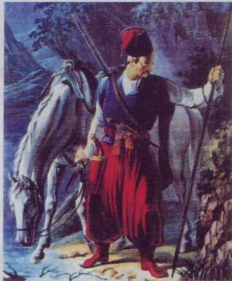
Запорожский казак. XVIII в.