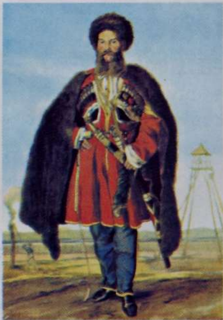
Линейный казак. XIX в.