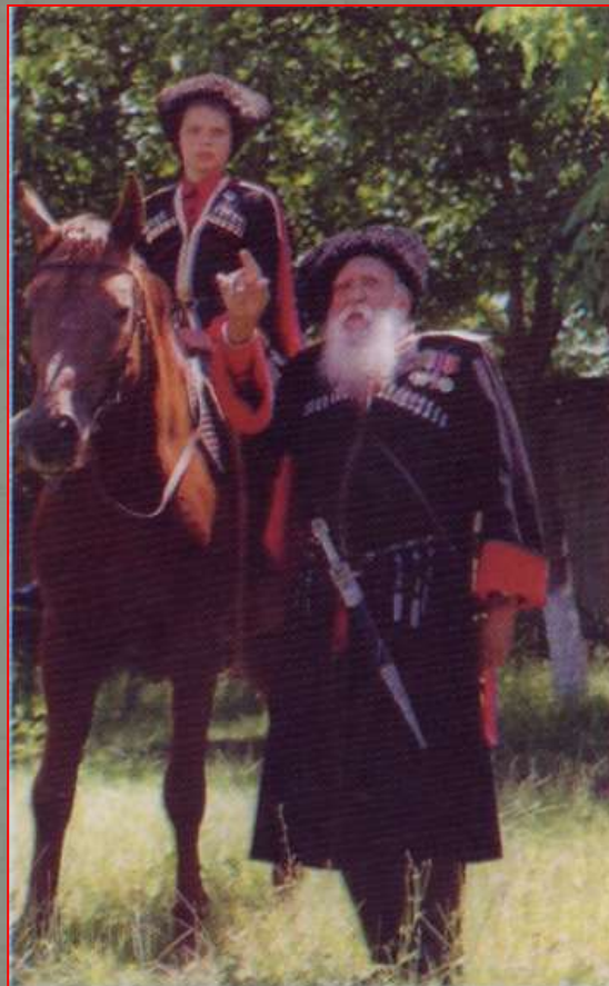
Два поколения казаков