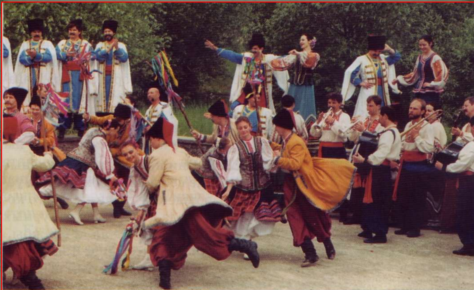
Зажигательная казачья пляска