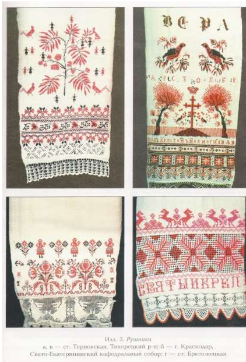
Илл. 3. Рушники

а, в — ст. Терновская, Тихорецкий р-н; б — г. Краснодар, Свято-Екатерининский кафедральный собор; г — ст. Брюховецкая