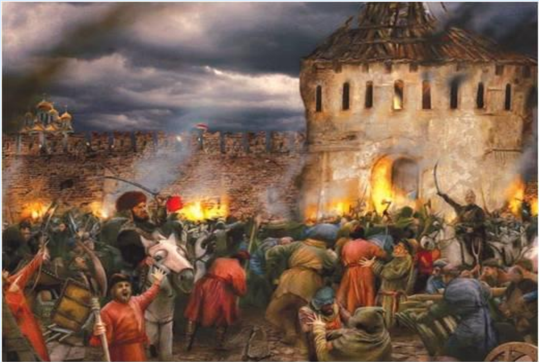
Вход Минина и Пожарского в Китай-город