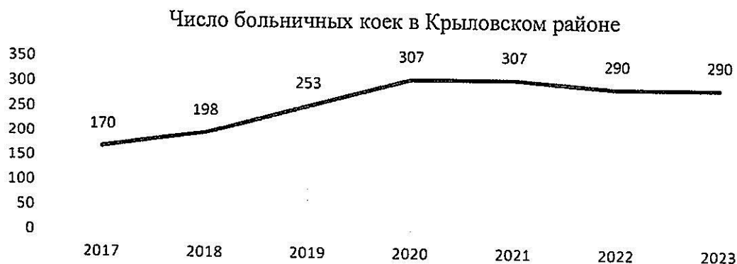
Рисунок № 1